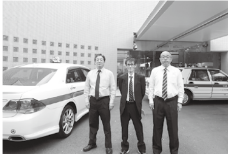
訓練に参加した荒川支部の皆さん

救護所から個人タクシーの車内までの傷病者搬送の際には、傷病者の名前や性別、搬送先などを確認してから乗り込みを行うなど、訓練の内容が少しずつ改善されているのが感じられた。参加者からは「傷病者のケガによっては車内への乗り込みが難しいと感じた。傷病者を見てドライバーの方が先に動いてくれたので助かった」という声が上がっていた。