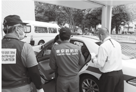
緊急医療救護所への連絡は本番さながらの雰囲気