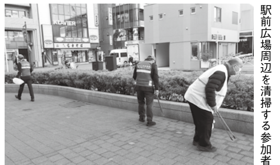
駅前広場周辺を清掃する参加者

で行ってほしいと伝えたいが、「あなたひどい人だね」(通り抜けができない場所だったため)とのしられて、恐怖を感じた。「では、結構です」と伝えたら、「早く言えよ」と怒鳴られ、非常に不快でした。ドラレコで確認して下さい。恐怖でタクシーに乗れません。 (男性・インフルエンサー)