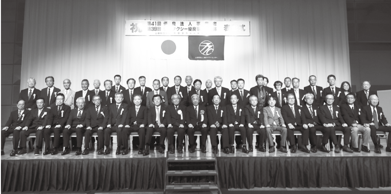
優良事業者団体の代表による記念撮影