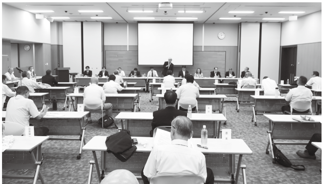
令和6年度第1回無線責任者会議

「なんだという考え方で、システム運用している。そうではなくて取れるような状態にするシステムにする、そういう要望をどんどん上げてほしい」と