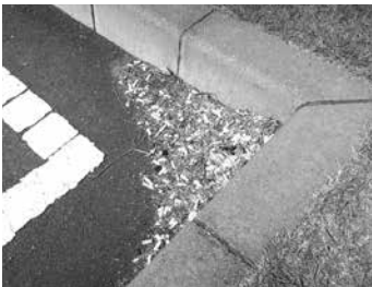
タクシープールの隅には多くのタバコの吸い殻が